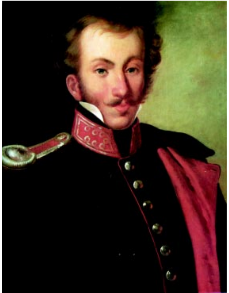
Ο Δημήτριος Υψηλάντης υπήρξε ο πρώτος Στρατάρχης της νεωτέρας Ελλάδος..

Με τον νέο Οργανισμό των Χιλιαρχιών ήταν φυσικό να αποκλεισθούν οι ηλικιωμένοι αρχηγοί, γιατί συνηθισμένοι στον βαθμό του στρατηγού ήταν αδύνατο να ικανοποιηθούν με τον βαθμό του χιλίαρχου. Οι γνώσεις τους για την σύγχρονη Ευρωπαϊκή τακτική ήταν μηδαμινές και επιπλέον, πρόθεση του Υψηλάντη ήταν να παραδώσει την διοίκηση των στρατιωτικών μονάδων, σε νεαρούς Αξιωματικούς που ήταν εύκαμπτοι και πιο ευάγωγοι στην πειθαρχία. Ο Καποδίστριας προκειμένου να ικανοποιήσει τους ηλικιωμένους αρχη-