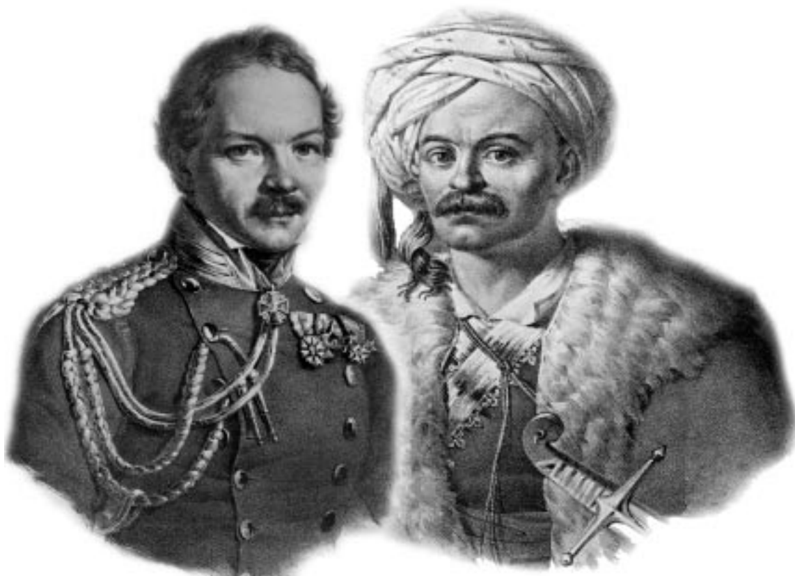
Οι φιλλέλληνες Βαυαρός Συνταγματάρχης Karl Wilhelm Heideck(αριστερά) και Γάλλος Συνταγματάρχης Charles Fabvier(δεξιά).

ράδοση του Γαλλικού στρατιωτικού πνεύματος.