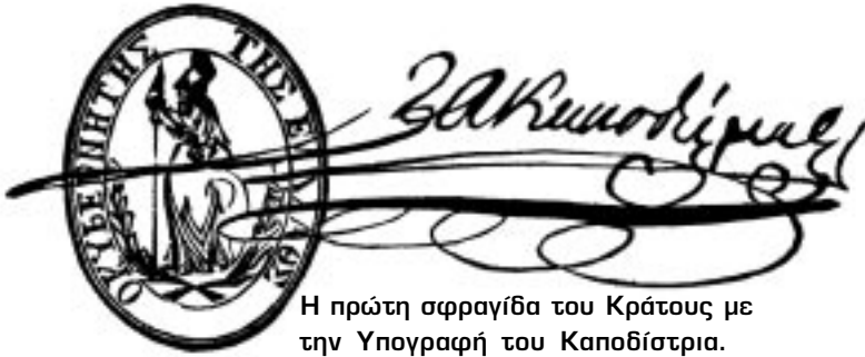
Η πρώτη σφραγίδα του Κράτους με την Υπογραφή του Καποδίστρια.

είχε καταστρώσει μια πρόχειρη στρατιωτική ιεραρχία, με ανώτατους βαθμούς του Αρχιστρατήγου, Σωματάρχη, Στρατηγού, Ταγματάρχη και κατόπιν του Χιλίαρχου. Η οργάνωση των ατάκτων ήταν για τον Καποδίστρια το δυσκολότερο πρόβλημα μετά το οικονομικό. Είναι προς τιμή της διορατικότητάς του ότι δεν απέλυσε όλους τους άτακτους, αλλά μόνο τους Πελοποννησίους, γιατί η οργάνωσή τους δεν ήταν εξαιρετικά αναγκαία. Άλλωστε, οι περισσότεροι Πελοποννήσιοι ήταν γεωργοί και βοσκοί και μετά την αποχώρηση του Ιμπραήμ από την Πελοπόννησο, είχαν αρχίσει να γυρίζουν στις ιδιαίτερες πατρίδες τους και στα χωράφια τους.