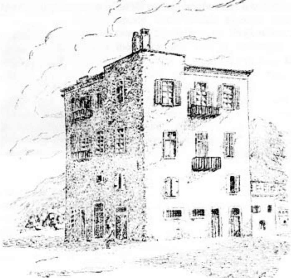
Η Σχολή Ευελπίδων στο Ναύπλιο (1828-1834).

σώματος των " Οχυρωματοποιών και Μηχανοποιών " όπως λέγονταν τότε το Μηχανικό (όπως στο Σχεδιάγραμμα της σελίδας 36). Επίσης, πέτυχε την έγκριση της Γαλλικής Κυβερνήσεως για κατάρτιση στον Ελληνικό στρατό, ως εκπαιδευτών αριθμού Αξιωματικών και Υπαξιωματικών του Γαλλικού στρατού κατοχής των φρουριών της Πελοποννήσου. Η εκπαίδευση γινόταν σύμφωνα με τους Γαλλικούς κανονισμούς και για την βελτίωση της εκπαίδευσης οργανώθηκε το πρώτο στρατόπεδο εκπαίδευσης στα Μέγαρα. Οι Γάλλοι Αξιωματικοί και Υπαξιωματικοί, εισήγαγαν στον Ελληνικό στρατό την Γαλλική στρατιωτική εκπαίδευση και νοοτροπία, με αποτέλεσμα να αποτυπωθεί έντονα σε αυτόν η φημισμένη πα-