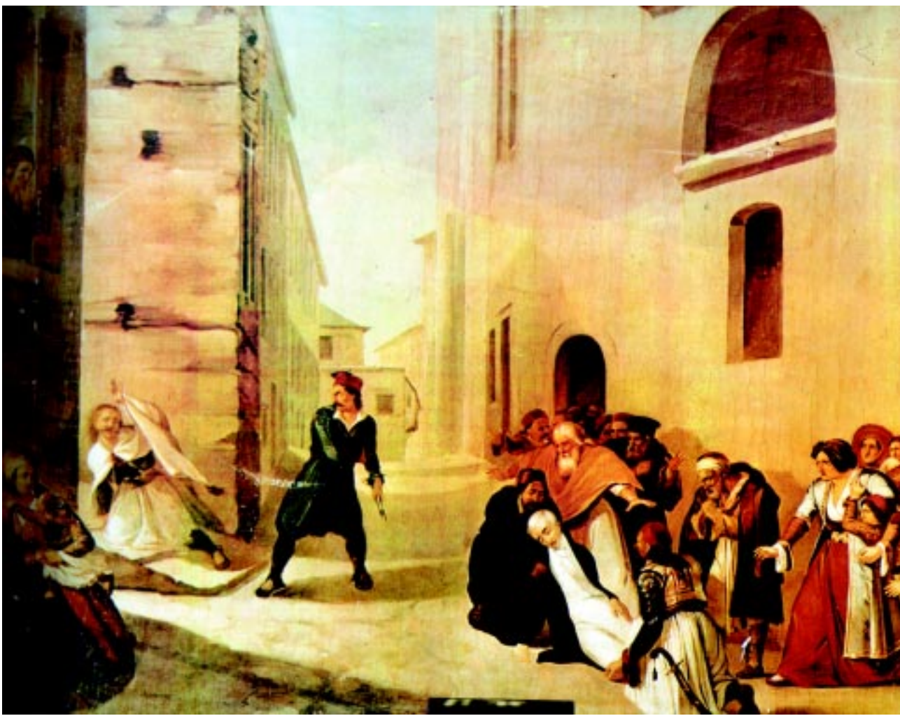
Η δολοφονία του Καποδίστρια στο Ναύπλιο.

τισε 13 ελαφρά Ταγματα , τα οποία θα χρoσίμευαν για την φύλαξη των συνόρων. Τους Αξιοματικούς που περίσσευσαν από αυτή την αναδιοργάνωση κατέταξε, μαζί με άλλους που παρέμειναν εκτός σώματος παλαιούς οπλαρχηγούς, σ' ένα ενιαίο σώμα καλούμενο " Ταξιαρχικόν ". Οι υπηρετούντες σε αυτό ελάμβαναν τον μισδό του βαθμού τους, χωρίς όμως να αναλαμβάνουν ενεργό υπηρεσία. Πρωταγωνιστής στην ίδρυση των ελαφρών Ταγμάτων, υπήρξε ο αδελφός του Κυβερνήτη Αυγουστίνος Καποδίστριας , μια προσωπικότητα που εισέβαλε στα πολιτικά και στρατιωτικά δρώμενα της χώρας, ως αποτέλεσμα ενός παρατεταμένου κλίματος δυσπιστίας, που μια σειρά γεγονότων είχε επιβάλει στον