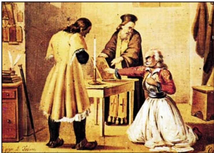
Ο όρκος των Φιλικών. Αθήνα, Εθνικό Ιστορικό Μουσείο.

- Είμαι σίγουρος πώς εσύ γνωρίζεις την Αρχή.