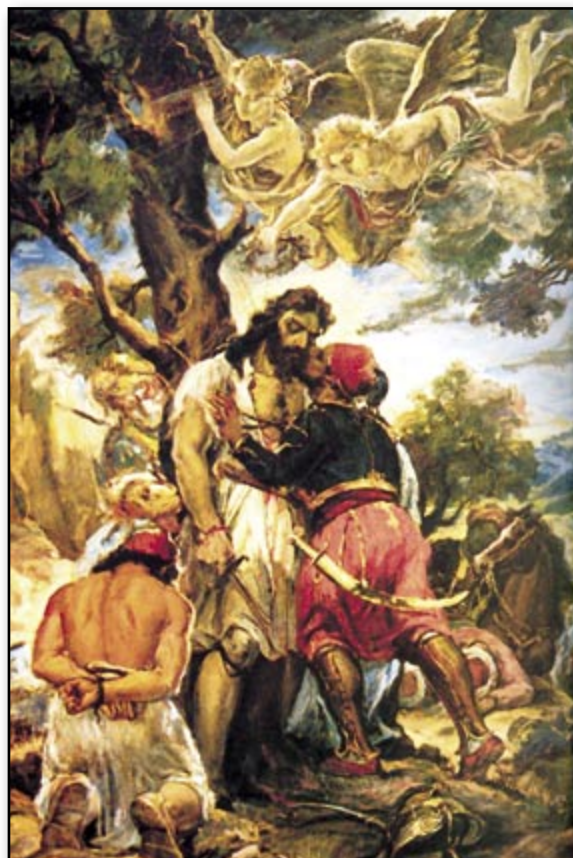
Το φίλημα του Ιμπραήμ στο νεκρό Παπαφλέσσα

Έφτασαν όμως αργά. Ο Ιμπραήμ τότε, γυρεύοντας να προλάβει τη βοήθεια που ερχόταν, ρίχνει όλες του τις δυνάμεις πάνω στους Έλληνες. Οι εχθροί πάτησαν πρώτα το ταμπούρι του Παπαφλέσσα. «Εκεί δε κτυπών και κτυπούμενος υπό πολλών Τούρκων εχάθη και αυτός και οι στρατιώται του, οι οποίοι δεν ηξεύρομεν πόσοι ήσαν, και αν από αυτούς εσώθησαν και πόσοι. Τούτο δε ηξεύρομεν, ότι ο σημαιοφόρος του ονομαζόμενος Δημήτριος και καταγόμενος από την Χίον, ιδών ότι οι Τούρκοι επήδησαν εις το οχύρωμα, αμέσως εκατέβασε την σημαίαν, έσχισεν αυτήν, έκοψε το ξύλον, έβαλεν εις