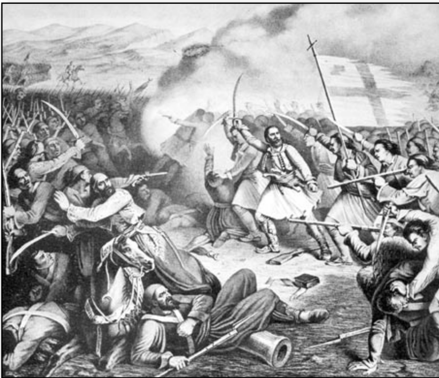
Φανταστική σύνδεση με θέμα τον ηρωικό θάνατο του Παπαφλέσσα στο Μανιάκι. Αθήνα, Μουσείο Μπενάκη.

ανοικτό το δρόμο προς την Μάνη και να του έρχεται εύκολα βοήθεια. Ο Αρχιμανδρίτης του αποκρίνεται: «Νικητά! έλαβον την επιστολήν σου και εις απάντησιν σου λέγω ότι δεν είμαι σαν και σε και σαν τον κουμπάρο σου τον Κεφάλα όπου τρέχετε από ράχη σε ράχη σαν τους αγιλιάδες. Εγώ άπαξ ωρρίσθην να χύσω το αίμα μου εις την ανάγκην της πατρίδος, και αυτή είναι η ώρα. Εύχομαι δε εις τον Θεόν πρώτη μπαλιά του Ιμβραΐμ να με πάρει εις το κεφάλι, διότι σας γράφω να ταχύνετε τον ερχομόν σας και σεις μου γράφετε κουρουφέξαλα. Νικητά, πρώτη και τελευταία επιστολή μου είναι αυτή, βάστα την να την διαβάζεις καμμιά φορά να με ενθυμήσαι να κλαίης. Παπαφλέσσας 10 ». Το συγκινητικό αυτό γράμμα προς τον αδελφό