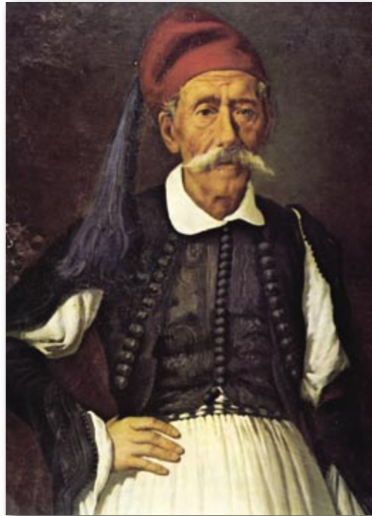
Κανέλλος Δεληγιάννης Αθήνα, Εθνικό Ιστορικό Μουσείο.

Έτσι φεύγει από τη Βοστίτσα για τη Νότια Πελοπόννησο. Στο δρόμο ξεσήκωνε τους πάντες με τα φλογερά του λόγια. Στα Καλάβρυτα, ανάμεσα στους Φιλικούς του τόπου, γνώρισε το Νικόλαο Σολιώτη, ένθερμο οπαδό των απόψεών του, που πρώτος, στην κυρίως Ελλάδα στις 16 Μαρτίου 1821, στη θέση Πόρτες, κοντά στο χωριό Αγρίδι χτύπησε τους Τούρκους. Φτάνει στα Λαγκάδια της Αρκαδίας και συναντά τους Δεληγιανναίους με την κρυφή ελπίδα να τους πείσει ν' αρχίσουν την Επανάσταση. Μα και εκεί τον καρτερά η ίδια η απογοήτευση. Ο Κανέλλος Δεληγιάννης γράφει χαρακτηριστικά γι' αυτή τη συνάντηση «Είπομεν στον Παπαφλέσσα ότι ημείς με τους εδικούς σου λόγους και με του Υψηλάντη τα ονειροπολήματα, και με τας ξηράς και ανυπάρκτους υποσχέσεις δεν είμεθα ανόητοι, μήτε απελπισμένοι να καταστρέψωμεν την πατρίδα μας... και αν αποφασίσωμεν να κάμωμεν την Επανάστασιν θα σκεφθώμεν σοβαρώς και θα την κάμωμεν ημείς, χωρίς τας εδικάς σας ανύπαρκτους υποσχέσεις, και σε συμβουλεύομεν να υπάγεις εις έν απόκεντρο μοναστήρι να ησυχάσεις κρυμ-