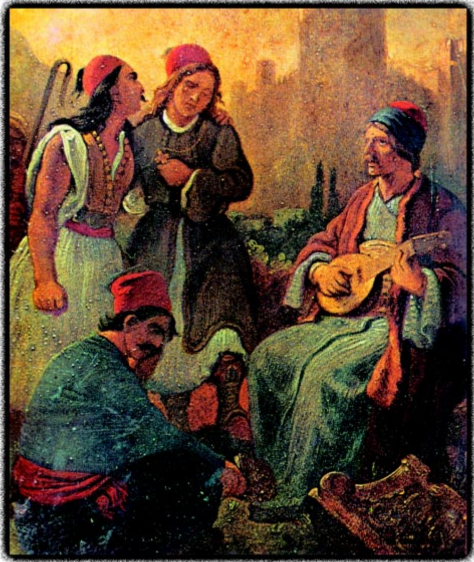
Ο Ρήγας ψάλλει το Θούριο που έγραψε και μελοποίησε ο ο ίδιος. (Εθνική Βιβλιοθήκη - Παρίσι).

θα είναι δημοκρατικό, με κύρια αρχή την ανεξιδρνηοκία. Χριστιανοί και Μουσουλμάνοι θα απολαμβάνουν τα ίδια δικαιώματα. Όλες οι εξουσίες θα πηγάζουν από το λαό. Τα σύννορα της “Νέας Πολιτείας” θα περιλαμβάνουν τη κεροδόνησο του Αίμου (Βαλκανική), τα νησιά του Αιγαίου και το κώρο της Μικράς Ασίας. Όλους τους κατοίκους τους αποκαλεί