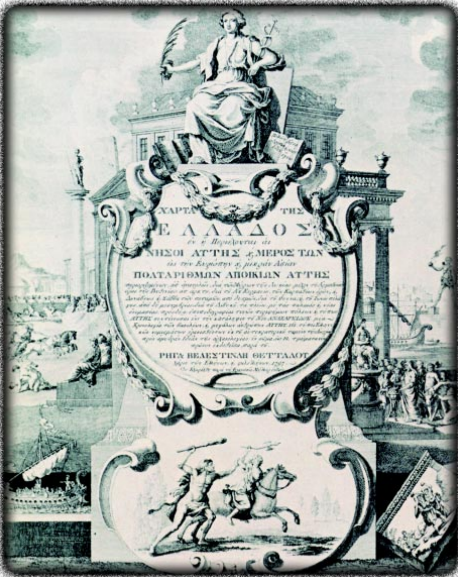
Η "Χάρτα" του Ρήγα Βελεστινλή. Με τα νομίσματα και τις άλλες παραστάσεις της ήταν αληθινή πατριωτική εγκυκλοπαίδεια (ΑΘΗΝΑ, Γεννάδειος Βιβλιοθήκη).

Μπαριελεμύ και την μετάφραση από την γαλλική του δράματος του Αββά Μετασασίου "Ηθικός Τρίπους".